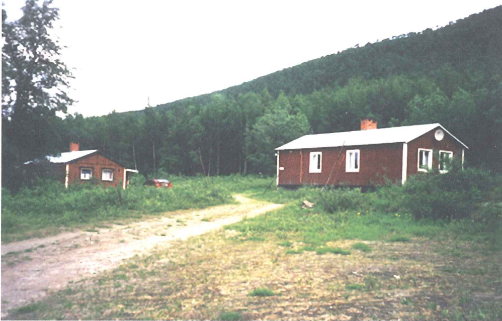
Fig. 2. Fritidshus på fastighet Krokfors 1:3. Foto mot N.

Innan utredningen fanns inga fornlämningar registrerade inom området