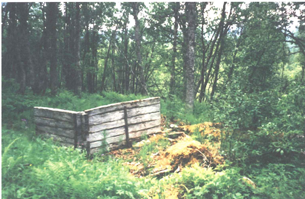
Fig. 3. Husgrund registrerad vid utredningen. Foto mot S.

Husgrundernas funktion är något oklar, men troligtvis rör det sig om två ekonomibyggnader, eventuellt kan den större husgrunden ha utgjort en mindre ladugård.