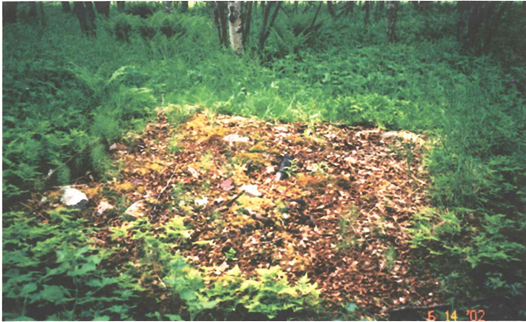
Fig. 4. Husgrund registrerad vid utredningen. Foto mot S.