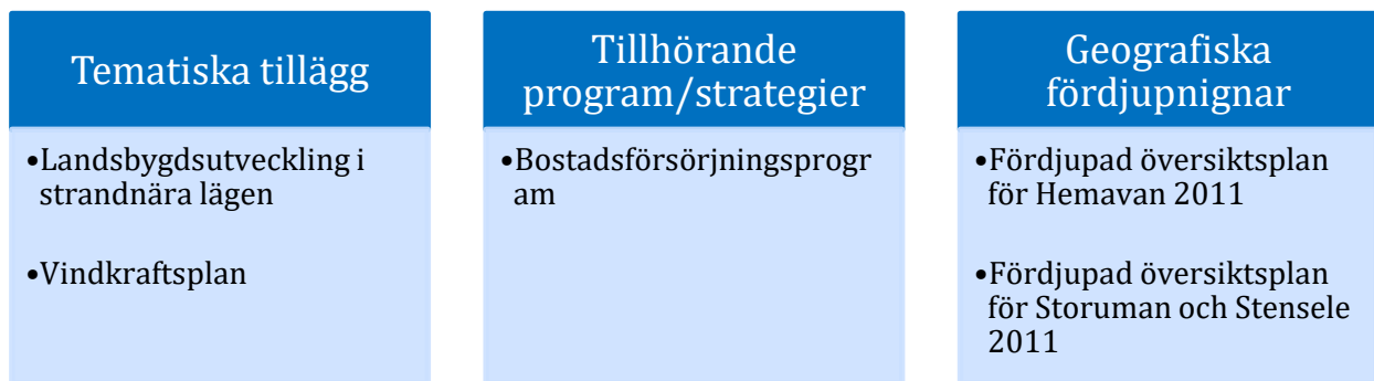
Figur 1. Översikt av dokumenten som omfattas av denna planeringsstrategi.