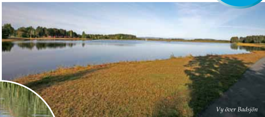
Wy över Badsjön

Viggen ( Aythya fuligula ) är en vanligt förekommande sjöfågel i badsjön och den är ganska lätt att känna igen. Hanen har en karakteristisk svart hängande nacktofs och en mestadels svart fjäderdräkt med vita sidor under parningstid. Honan är mer brun i färgen och har en mindre nacktofs. Längden är 44 centimeter mellan näbb och stjärt. Viggen hör till familjen dykänder.