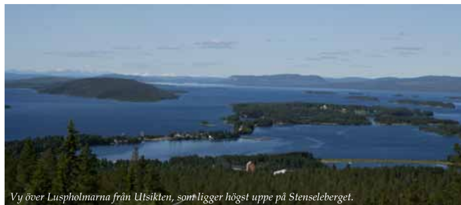
Vy över Luspholmarna från Utsikten, som ligger högst uppe på Stenseleberget.

Nära till: Utflyktmålen Badsjön och Luspen