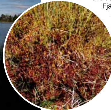
Starr och mossa

Fjäderdräkten är gråbrunstrimmig och ser man småspoven på nära håll har den en mörk hjässa med ett ljus hjässband. Vintertid återfinns småspoven huvudsakligen längs tropiska Västafrikas kuster.