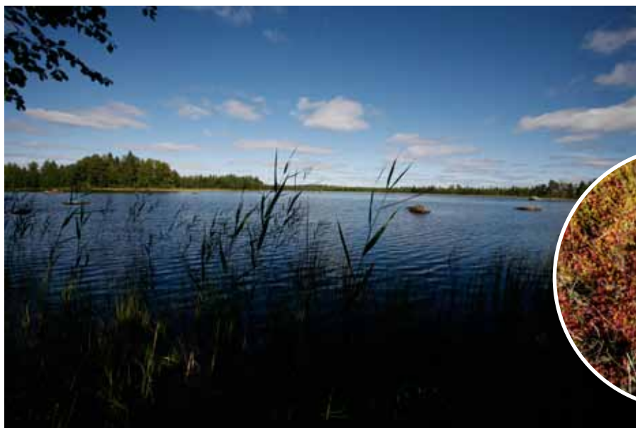
Bredselet, också en bra plats för fågelskådning