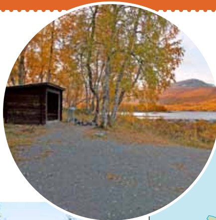
« Vindskydd vid hängbron i Solberg »

Hemavan Tärnaby Turistbyrå 0954-104 50 Statoil Tärnaby 0954 - 100 14 Tärnaby Sport 0954-100 44