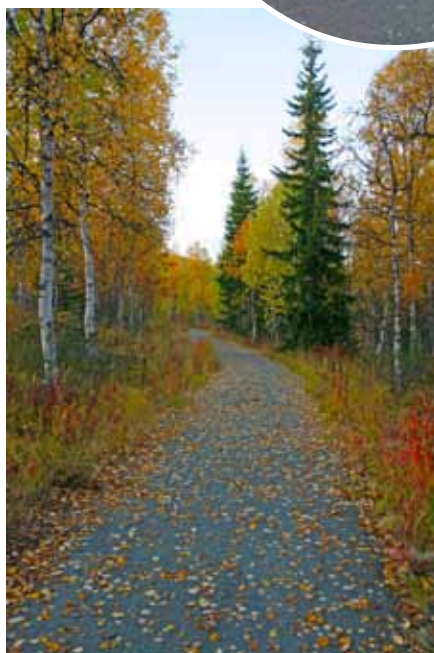
Stigen vid Tärnaåleden