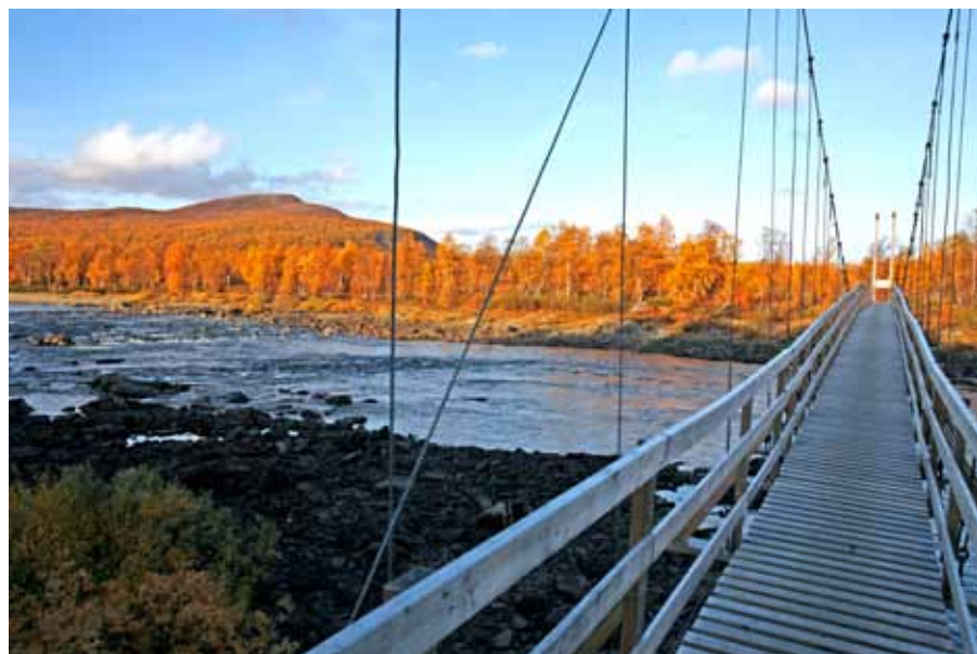
Hängbron över Tärnaån i Solberg