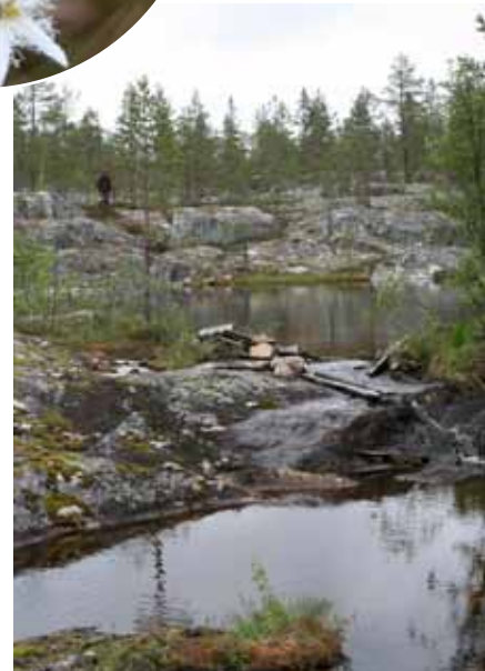
Hällandskap med jättegrytor

Mellan Storuman och Stensele ligger detta smultronställe. En plats som vittnar om istidens krafter på naturen. Området är skyddat på grund av dess geologiska egenart då det är ett kalspolningsområde från den sista nedisningens slutskede. Naturreseptatet har fungerat som utlopp för en issjö. I reservatet finns