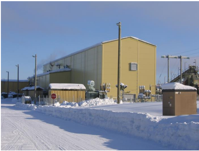
Anrikningsverket i Svartliden. Dragon Mining (Sweden) AB.