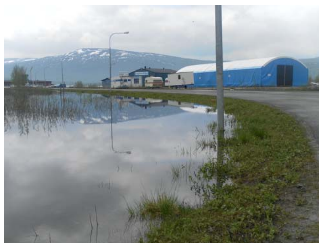
Bilderna visar översvämning på angränsande mark.

För att säkerställa ett säkert byggande införs bestämmelse om lägsta höjd på färdigt golv inom planområdet.