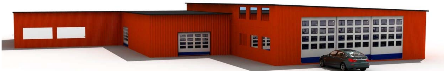
Illustration av möjlig utformning av verkstad/butik i en våning till att börja med.

2014-09-18 beslutade Miljö- och samhällsbyggnadsnämnden i Storuman att påbörja arbetet med att upprätta detaljplan för del av Björkfors 1:122 för bilverkstad/handel och skoterhandel-/tankställe.