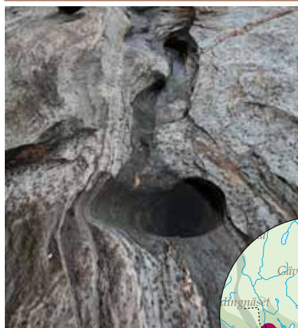
Stenformationer i skifferbergarten

Vattnet skiftar i grönt och blått och blir behagligt sovkande när stenarna värms upp av solen.