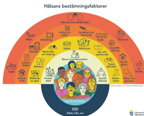
Bild 1. Hälsans bestämningfaktorer Källa: Länsstyrelsen Västerbotten. Bearbetad figur från Dahlgren och Whitehead, 1991.

De förutsättningar som påverkar individen benämns som hälsans bestämningfaktorer 11 . Ålder, kön och det genetiska arvet hör till faktorer som inte kan påverkas. Påverkbara faktorer finns i den miljö som individen lever och verkar inom. Det handlar bland annat om individens livsstil, sociala- och samhälleliga nätverk, levnads- och arbetsförhållanden samt generella socioekonomiska-, kulturella- och miljörelaterade förhållanden (Bild 1).