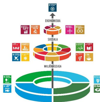
Bild 3. De tre dimensionerna i Agenda 2030.